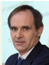
Pedro Portugal Gaspar Inspetor Geral da ASAE

No início deste novo ano importa naturalmente expressar os votos de felicidades e desejos de que 2015 constitua um ano de sucesso nos vários planos em que nos situamos, seja no campo pessoal, familiar e profissional, pelo que desejo a todos um feliz 2015.