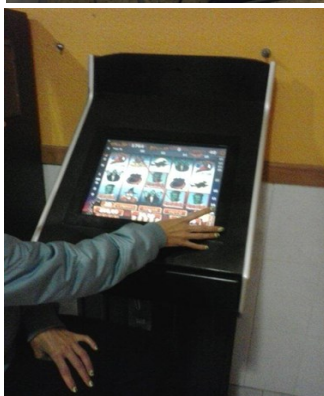
Figura 2 - Alguns exemplos de máquinas tipo “slot machine”.

Quando estas máquinas são alvo de investigação fora do flagrante delito é necessário que o Ministério Público ordene a respetiva perícia, para que se tente obter todo o software existente e obter meios de prova sobre a existência de jogos de fortuna ou azar.