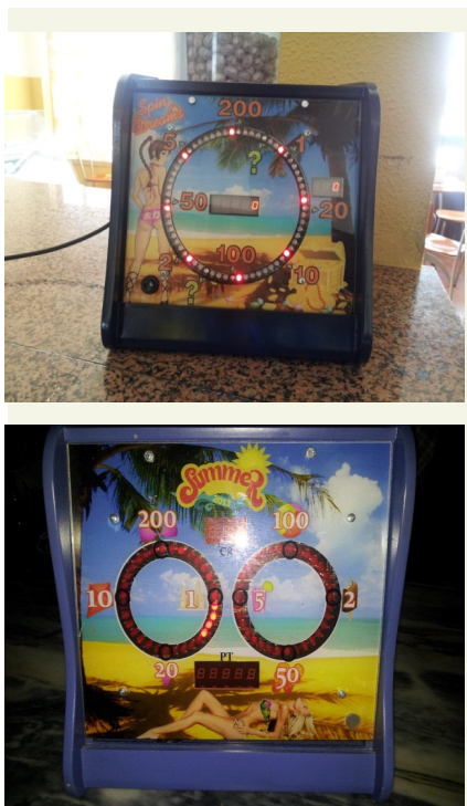
Figura 1 - Alguns exemplos de máquinas do género roleta.

Mais elaboradas são as máquinas de jogos legais que através de software são alteradas para que um utilizador comum apenas consiga aceder aos jogos legalmente permitidos.