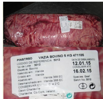
Carne usada na confeção da “Posta à Mirandesa”

Considerando que o produto anunciado é mais apreciado e comercialmente mais valorizado que o produto efetivamente servido, esta prática poderá ter contribuído para a obtenção de lucro ilegítimo.