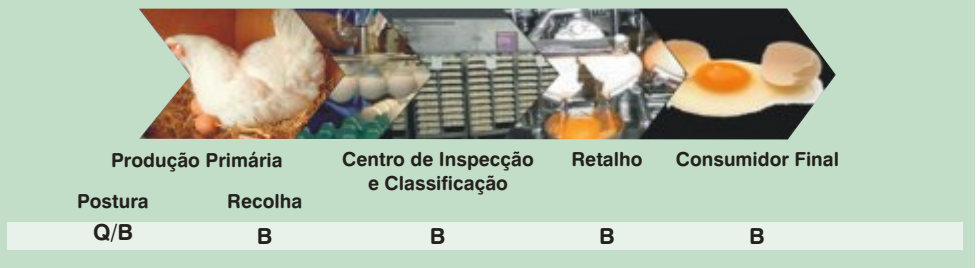
Fluxograma de um dos circuitos de alimentos abordados no estudo

actividade, achou-se preferível avançar com a realidade que conhecemos e tentar melhorar com a experiência adquirida através de um trabalho contínuo com objectivos bem definidos.