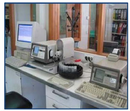
Laboratório de Bebidas e Produtos Vitivinícolas LBPV