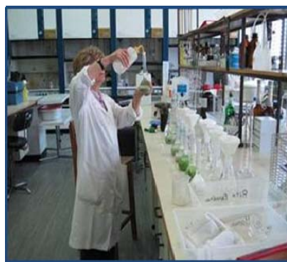
Laboratório de Físico-Química LFQ