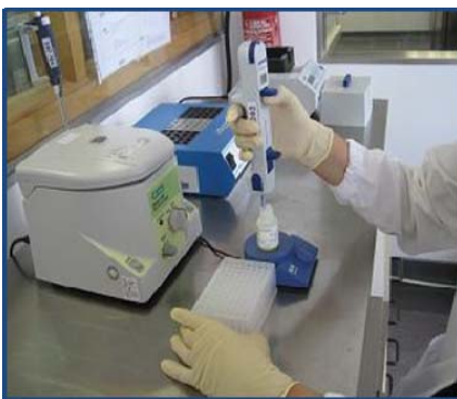
Laboratório de Microbiologia LM

Merece pois todo o destaque o facto de a ASAE possuir, desde agora, um Laboratório acreditado para a análise sensorial de azeite e, conseqüentemente, ver reconhecida a sua competência técnica na realização deste tipo de ensaios laboratoriais, bem como de passar a estar também acreditado para a realização dos ensaios químicos acima mencionados em que, aliás, já detinha num plano europeu o estatuto de Laboratório Nacional de Referência .